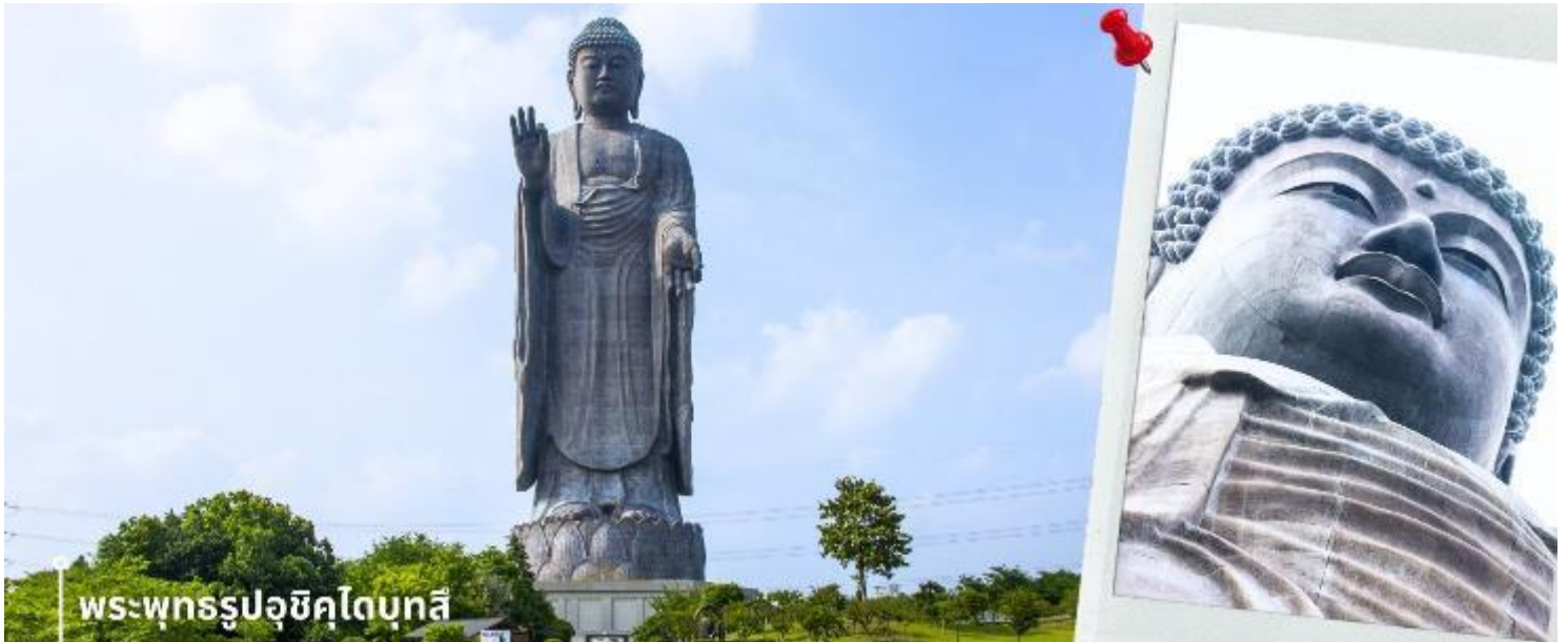
พระพุทธรูปอุชิวโคโตบุทสึ

หลังรับประทานอาหารเที่ยง นำท่านเดินทางชม พระพุทธรูปปางยืน ที่องค์ใหญ่ติดอันดับโลก นั่นก็คือ พระพุทธรูปอุชิวโคโตบุทสึ โดยในปี ค.ศ.1995 ได้รับการบันทึกลงในกินเนสบุ๊คว่า เป็นพระพุทธรูปปางยืนที่หล่อด้วยสัมฤทธิ์ที่สูงที่สุดในโลก โดยสูงถึง 120 เมตร และยังสูงเป็นอันดับที่ 3 ของโลก พระพุทธรูปอุชิวโคโตบุทสึ ถูกสร้างขึ้น ในปีค.ศ. 1992 บนพื้นที่บริสุทธิ์ของสุสาน และปีต่อมาก็ถูกทำให้เป็นสวนสาธารณะ และยิ่งไปกว่านั้น บริเวณรอบๆ พระพุทธรูปจะเป็นสวนสาธารณะ ที่มีการปลูกดอกไม้ตามฤดูกาลไว้อย่างงดงาม ภายในสวนยังมีดอกไม้บานาพันธุ์ให้ท่านได้ชม ไม่ว่าจะเป็น ดอกไฮเดรนเยีย โบตัน ซากุระ ต้นฟลอกสมอส บ๊อบบี้ และคอสมอส เป็นต้น ซึ่งสลับกันเบ่งบานตลอดทั้งปี แต่ทั้งนี้ก็ขึ้นอยู่กับฤดูกาลและชนิดของดอกไม้ ให้ท่านได้อิสระเดินชมและเก็บภาพความประทับใจ