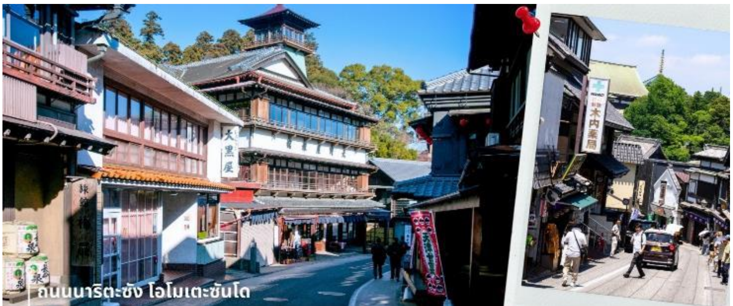
ถนนนาริตะซัง โอโมเตะซันโด

ถนนแห่งนี้เรียกกันว่า ถนนนาริตะซัง โอโมเตะซันโด ที่มีทั้งของที่ระลึก ของกิน ของใช้ หลากอย่างยังมีขาย เฉพาะแค่ที่ถนนแห่งนี้อีกด้วย กับความยาวของถนนที่มีความยาว 800 เมตร ทั้ง 2 ฝั่งถนนมีร้านค้ากว่า 150 ร้านตั้ง เรียงรายกัน และบรรยากาศที่ถนนแห่งนี้ยังมีความย้อนยุคราวกับญี่ปุ่นในสมัยโบราณ บ้านเรือนยังคงกลิ่นอายความ เป็นญี่ปุ่นในสมัยเก่า และที่พลาดไม่ได้หรือเรียกได้ว่าเป็นไฮไลท์ของที่ถนนแห่งนี้เลยก็คือ ข้าวหน้าปลาไหลเจ้า เก้าแก่ที่ขึ้นชื่อของที่นี่ ที่ทั้งคนญี่ปุ่นและนักท่องเที่ยวผ่านมาต้องแวะมากิน ให้ท่านอิสระเดินสัมผัสบรรยากาศและ เก็บภาพความประทับใจตามอัธยาศัย