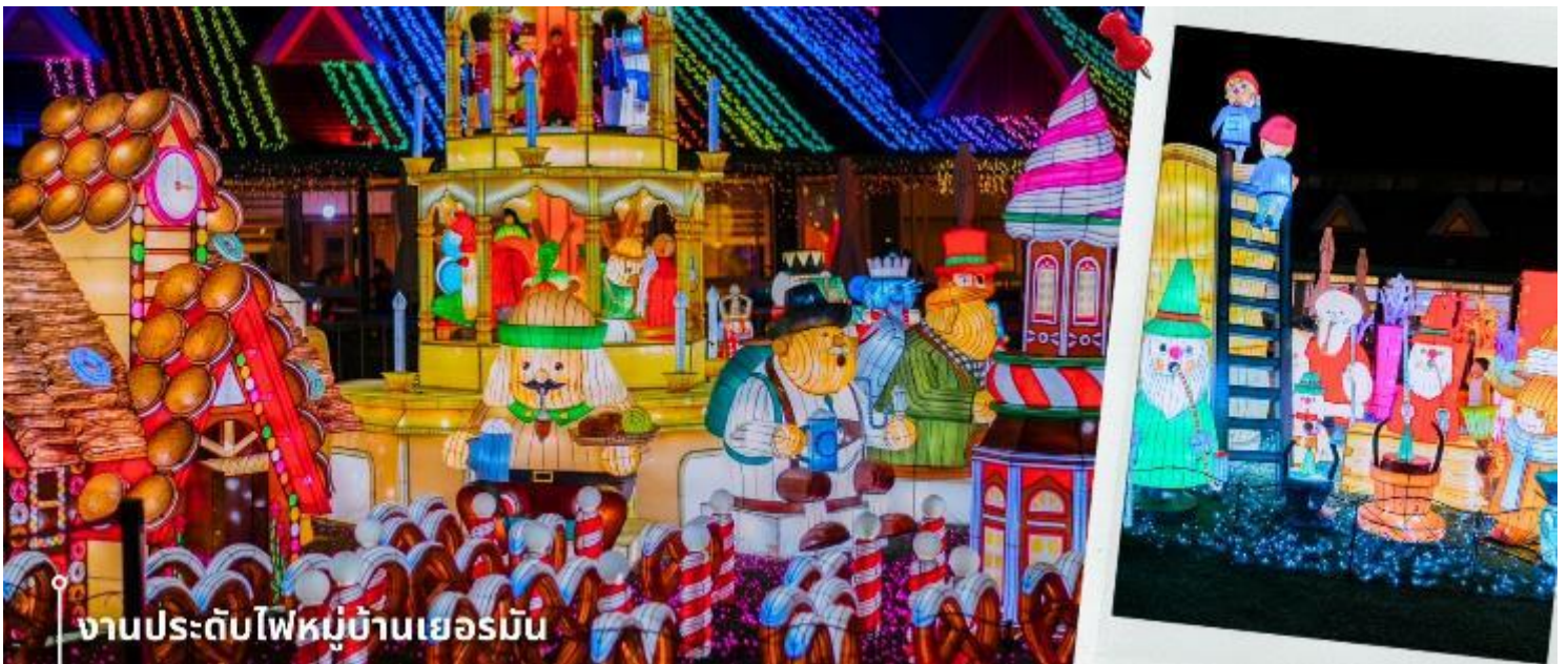
งานประดับไฟหมู่บ้านเยอรมัน

จากนั้นนำท่านเดินทางชม งานประดับไฟหมู่บ้านเยอรมัน (Tokyo German Village) คือชื่อของธีมพาร์คสไตล์หมู่บ้านเยอรมัน หรือเทศกาลประดับไฟฤดูหนาวของที่นี่ ซึ่งจัดติดต่อกันมามากกว่า 10 ปี ตั้งอยู่ในจังหวัดชิบะ บนพื้นที่ขนาดใหญ่กว่า 60,000 ตารางเมตร ที่จำลองบรรยากาศของฟาร์มในชนบทประเทศเยอรมนีมาไว้ที่ญี่ปุ่น ได้อย่างสวยงาม และมีการจัดงานประดับไฟช่วงฤดูหนาว Tokyo German Village Winter illumination เป็นงานประดับไฟฤดูหนาวที่ยิ่งใหญ่อลังการจนได้ชื่อว่าเป็น 1 ใน 10 งานประดับไฟที่สวยงามที่สุดในญี่ปุ่น ในแต่ละปีก็ยังมีธีมการจัดแสดงไฟและธีมงานที่แตกต่างกันไป ซึ่งจะเป็นสถาปัตยกรรมสไตล์เยอรมันที่ประดับตกแต่งด้วยแสงไฟสวยงาม โดยจะประดับหลอดไฟหลากสีสั้นทั้งสั้นกว่า 3 ล้านดวงจนแสงสว่างพราว สว่างไสวไปทั่วทั้งบริเวณภายในพาร์ค ซึ่งให้ความรู้สึกราวกับหลุดเข้าไปอยู่ในเทพนิยาย อีกทั้งโชว์ ที่มีการแสดงแสงสีเสียง 3D illumination ที่เน้นศิลปะและเทคโนโลยีที่สอดคล้องกับธีมในแต่ละปีเข้าไว้ด้วยกันช่วยสร้างบรรยากาศให้ยิ่งคึกคักและเพิ่มความสวยงามให้กับธีมพาร์คแห่งนี้ยิ่งขึ้นไปอีก ให้ท่านอิสระเก็บภาพความประทับใจตามอัธยาศัย