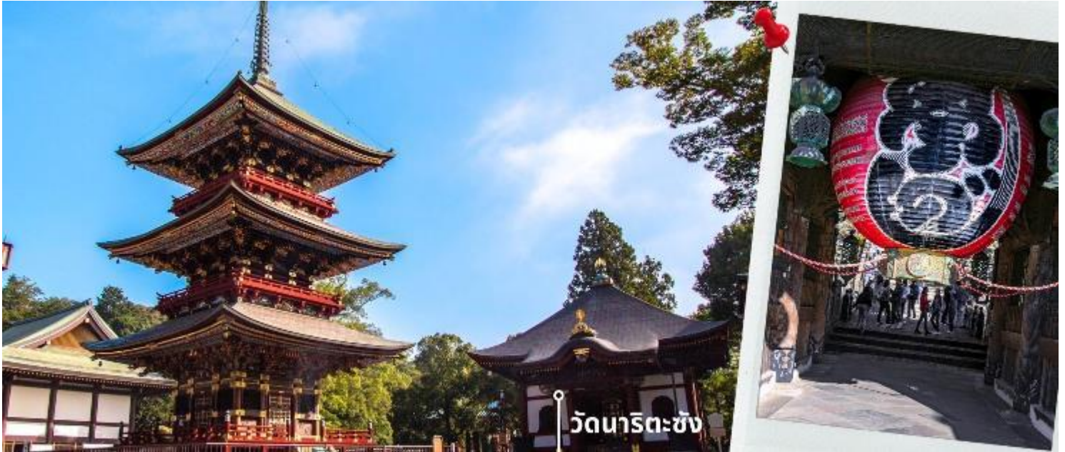
วัดนาริตะซัง

ถนนแห่งนี้เรียกกันว่า ถนนนาริตะซัง โอโมเตะซันโด ที่มีทั้งของที่ระลึก ของกิน ของใช้ หลากอย่างยังมีขาย เฉพาะแค่ที่ถนนแห่งนี้อีกด้วย กับความยาวของถนนที่มีความยาว 800 เมตร ทั้ง 2 ฝั่งถนนมีร้านค้ากว่า 150 ร้านตั้ง เรียงรายกัน และบรรยากาศที่ถนนแห่งนี้ยังมีความย้อนยุคราวกับญี่ปุ่นในสมัยโบราณ บ้านเรือนยังคงกลิ่นอายความ เป็นญี่ปุ่นในสมัยเก่า และที่พลาดไม่ได้หรือเรียกได้ว่าเป็นไฮไลท์ของที่ถนนแห่งนี้เลยก็คือ ข้าวหน้าปลาไหลเจ้า เก้าแก่ที่ขึ้นชื่อของที่นี่ ที่ทั้งคนญี่ปุ่นและนักท่องเที่ยวผ่านมาต้องแวะมากิน ให้ท่านอิสระเดินสัมผัสบรรยากาศและ เก็บภาพความประทับใจตามอัธยาศัย