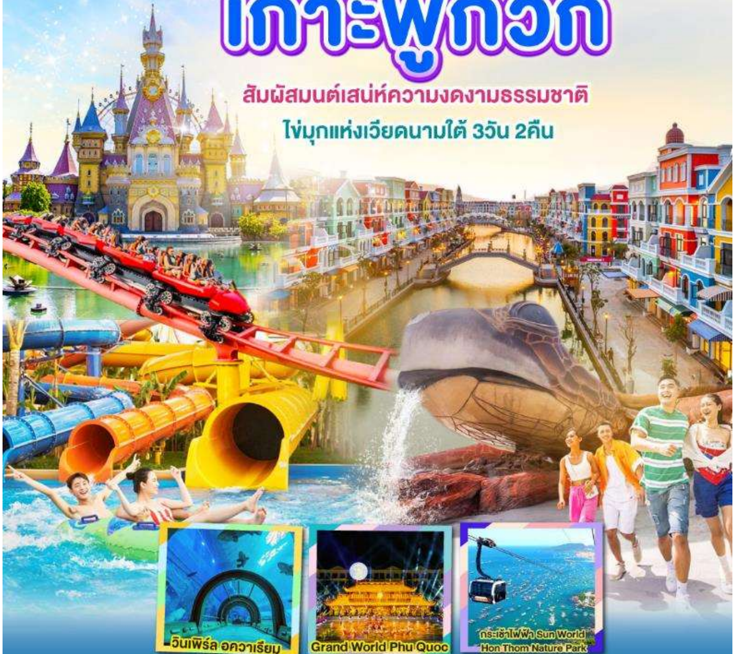
วินเพิร์ล อควาเรียม