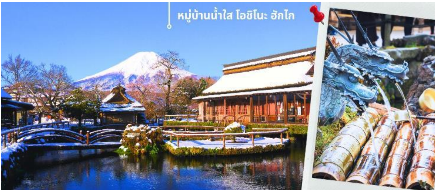
หมู่บ้านน้ำใส โอชิโนะ ฮักไก

และนำท่านเดินทางสู่ หมู่บ้านน้ำใส โอชิโนะ ฮักไก (Oshino hakkai) ถือเป็นหมู่บ้านแห่งการท่องเที่ยวที่ยังคงความอุดมสมบูรณ์ของธรรมชาติเอาไว้ได้อย่างดีในหมู่บ้านมีบ่อน้ำใสที่เป็นน้ำที่ละลายมาจากหิมะบนภูเขาไฟฟูจิ ที่นี่มีความสวยงามในระดับที่ว่าได้รับการขึ้นทะเบียนให้เป็นมรดกทางธรรมชาติ ในปี ค.ศ. 1934 และได้รับคัดเลือกให้เป็นหนึ่งในภูมิทัศน์ทางน้ำที่งดงามในปีค.ศ. 1985 อีกด้วย ไฮไลท์ในช่วงฤดูหนาว เราจะสามารถเห็นบรรยากาศหมู่บ้านที่ปกคลุมไปด้วยหิมะ ทั่วบริเวณ ให้ความสวยงามและความโรแมนติกไปอีกแบบ ทั้งยังเป็นอีกหนึ่งสถานที่ที่เราสามารถมองเห็นวิวฟูจิ หากวันนั้นเป็นวันที่ฟ้าเปิด