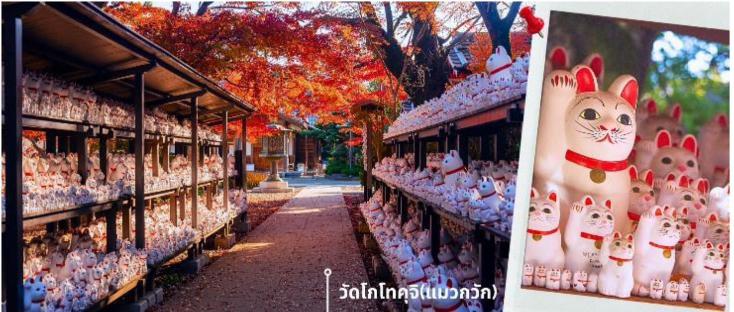
วัดโกโทคุจิ(แมวแก้ว)

ภายในวัดด้วย แม้จะไม่ได้ตั้งอยู่ในย่านท่องเที่ยวยอดนิยมแต่การเดินทางไปเยือนวัดโกโทคุจิถือเป็นโอกาสดีในการสัมผัสอีกมุมมองหนึ่งของโตเกียว ให้ท่านได้อิสระถ่ายภาพกับเหล่าบรรดารูปปั้นแมวแก้ว และเก็บความประทับใจกับบรรยากาศโดยรอบ