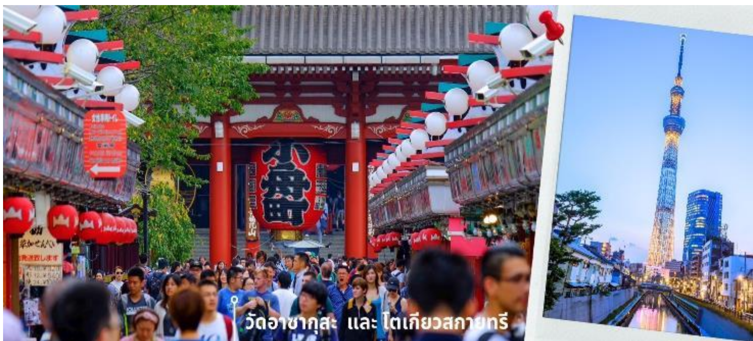
วัดอาซากุสะ และ โตเกียวสกายทรี

เดินทางถึงสนามบินนาริตะ ประเทศญี่ปุ่น หลังจากผ่านพิธีตรวจคนเข้าเมืองและศุลกากรแล้ว นำท่านขึ้นรถโค้ชปรับอากาศ เดินทางออกจากสนามบิน เพื่อ นำท่านเดินทางสู่ เมืองโตเกียว (ใช้เวลาเดินทางประมาณ 1 ชั่วโมง) พาท่านสักการะ ที่ วัดอาซากุสะ (Asakusa Temple) วัดที่ได้ชื่อว่าเป็นวัดที่มีความศักดิ์สิทธิ์และได้รับความเคารพนับถือมากที่สุดแห่งหนึ่งในกรุงโตเกียวภายในประดิษฐานองค์เจ้าแม่กวนอิมทองคำที่มักจะมีผู้คนมาราบไหว้ขอพรเพื่อความ เป็นสิริมงคลตลอดทั้งปีประกอบกับภายในวัดยังเป็นที่ตั้งของโคมไพร์กซ์ที่มีขนาดใหญ่ที่สุดในโลกด้วยความสูง 4.5 เมตรซึ่งแขวนห้อยอยู่ ณ ประตูทางเข้าที่อยู่ด้านหน้าสุดของวัดที่มีชื่อว่า “ประตูฟ้าคาร์ณ” บริเวณทางเข้าสู่ตัววิหารจะมี “ถนนนากามิเซะ” ซึ่งเป็นที่ตั้งของร้านค้าขายของที่ระลึกพื้นเมืองต่างๆมากมายเช่น หน้ากาก ของเล่น รองเท้า พวงกุญแจ ของที่ระลึก และขนม นานาชนิดทั้งเมล็ดอบบั้งในตำนาน ดังโงะหนึบหนับและน่องปลาขนมไทยากิ ฯลฯ ให้ทุกท่านได้เลือกซื้อเป็นของฝากของที่ระลึก ให้จากนั้นนำท่านแวะถ่ายรูปกับ “TOKYO SKYTREE” (ด้านนอก) ที่บริเวณสะพานข้ามแม่น้ำสุมิตะหนึ่งในแลนด์มาร์คของโตเกียวเป็นหอคอยส่งสัญญาณโทรทัศน์ที่เป็นสิ่งปลูกสร้างที่สูงที่สุดในญี่ปุ่นและเป็นหอคอยที่สูงที่สุดในโลกตั้งอยู่ที่เขตสุมิตะหน้าที่หลักของโตเกียวสกายทรีคือการกระจายสัญญาณสื่อสารแบบดิจิตอลและโตเกียวสกายทรียังแทรกความเป็นมาของท้องถิ่นเอาไว้ด้วยความสูงของหอคอย 634 เมตร มาจาก มุซาซึคินิชื่อเรียกในอดีตของแถบนี้ซึ่งตัวเลข 634 สามารถอ่านตามเสียงตัวเลขเป็นมุซาซึ