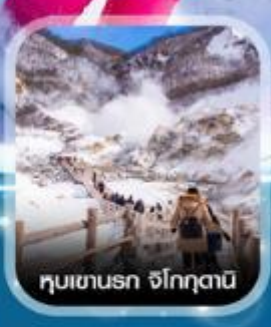
หุบเขานรก จิโอกุดานิ

✈️ คอนเฟิร์มออกเดินทาง ✈️ ทุกพีเรียด 2 ท่านขึ้นไป