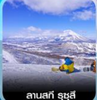
ลานสกี รุซุสี