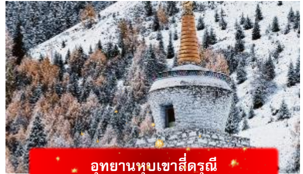
อุทยานหุบเขาสีดรุณี