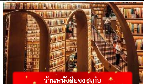
ร้านหนังสือจุงซูเก้อ

นำท่านเดินทางสู่ จุดเช็คอินตึกแฝด แลนด์มาร์คสุดล้ำใจกลางเมืองเฉิงตู ตึกแฝดสัญลักษณ์แห่งความทันสมัยที่ตั้งตระหง่านคู่กัน โดดเด่นทั้งกลางวันและยังสวยสะดุดตายามค่ำเมื่อมีการประดับไฟระยิบระยับ นักท่องเที่ยวไม่พลาดมาเก็บภาพมุมสวยเป็นที่ระลึก