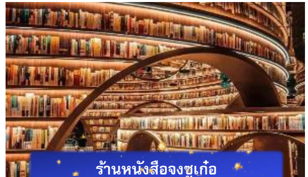
ร้านหนังสือจขูเก้อ