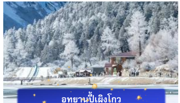
อุทยานปีเฝิงโกว

เช้า บริการอาหารเช้า ณ ห้องอาหารของโรงแรม หลังจากนั้นนำท่านสัมผัสสวรรค์แห่งธรรมชาติที่ อุทยานปีเฝิงโกว ค้นพบ มนต์เสน่ห์ของอุทยานปีเฝิงโกว สถานที่ที่ธรรมชาติรังสรรค์ความงามไว้ อย่างน่าทึ่งเปลิดเปลิบกับภูเขาหิมะตระการตา ทะเลสาบสีมรกตใสราว กระจก และป่าสีแสนสดใสที่เปลี่ยนไปตามฤดูกาล โดยเฉพาะในฤดูใบไม้ร่วง ที่ปกคลุมด้วยสีทองแดงและเหลืองระยิบระยับ (รวมรถอุทยานแล้ว หิมะ ขึ้นอยู่กับสภาพอากาศ)