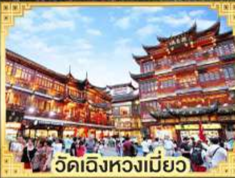
วัดเชิงหวงเมี่ยว