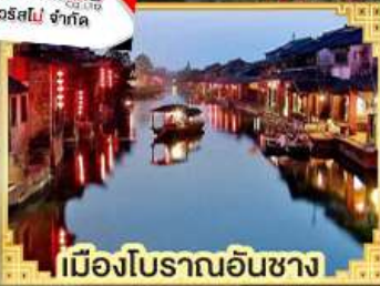
เมืองโบราณอันซาง