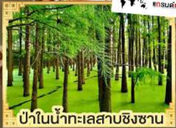
ป่าในน้ำทะเลสาบชิงชาน