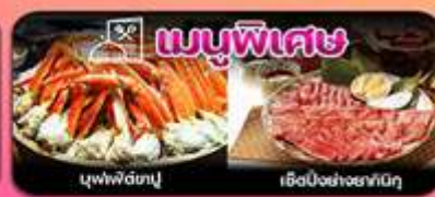
บุฟเฟ่ต์ยาปู