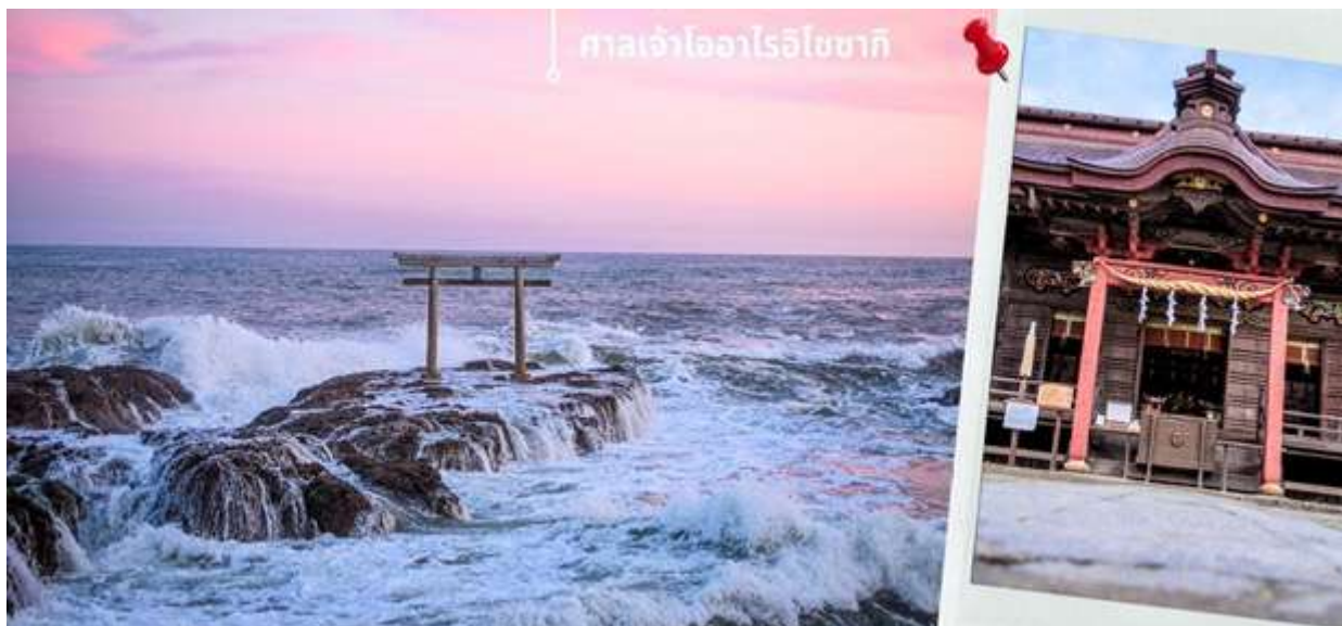
ศาลเจ้าโอะฮาไรโอะซากิ

** ระยะเวลาการตกของพระอาทิตย์ขึ้นอยู่กับสภาพอากาศและฤดูกาล **