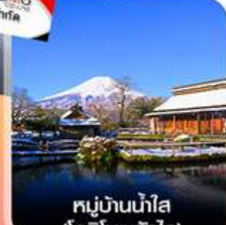
หมู่บ้านน้ำใส (โอชิโนะ ฮักไก)