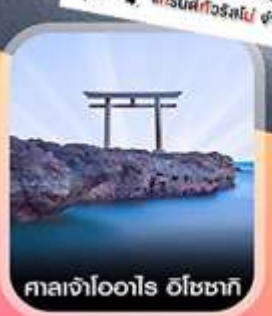
ศาลเจ้าโองาไร ฮิโระซากิ