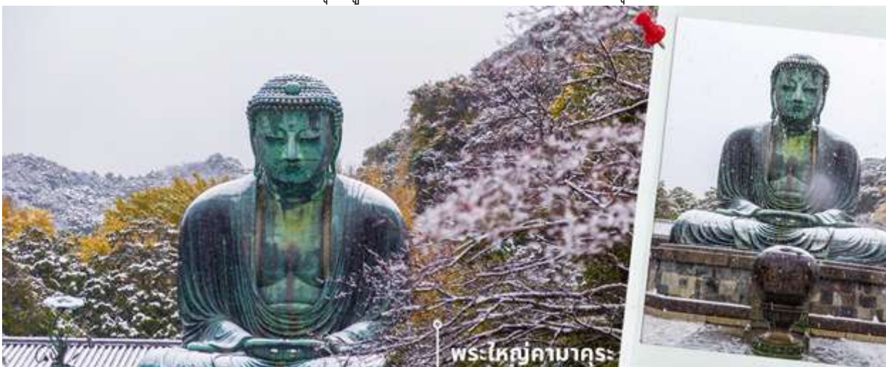
พระใหญ่คามาคุระ

หลังรับประทานอาหารเช้า เดินทางสู่ เมืองคามาคุระ (ใช้เวลาเดินทางประมาณ 1 ชั่วโมง 50 นาที ) พาท่านเข้าชม พระใหญ่คามาคุระ (Kamakura Daibutsu หรือ The Great Buddha) เป็นพระพุทธรูปที่สำคัญที่สุดในเมืองคามาคุระ ตั้งอยู่ในวัดโคโตะกุอิน (Kotokuin Temple) พระพุทธรูปโคโตะกุอินมีความสูงถึง 13.35 เมตร น้ำหนัก 95 ตัน เป็นพระพุทธรูปที่ใหญ่เป็นอันดับสองในญี่ปุ่น รองจากหลวงพ่อดโต แห่งวัดโทไดจิ เมืองนารา จากหลักฐานพบว่าพระใหญ่โคโตะกุอินสร้างขึ้นในปี ค.ศ.1252 ในตอนแรกนั้นพระพุทธรูปอยู่ในห้องโถงของวัด แต่ตัววัดได้รับความเสียหายจากพายุและแผ่นดินไหว อยู่หลายครั้ง จนในที่สุดไม่มีตัวอาคารของวัด พระใหญ่โคโตะกุอินจึงได้ตั้งอยู่กลางแจ้ง ชมความงามของพระพุทธรูปพร้อมกับบรรยากาศหิมะปกคลุมเพิ่มความสวยงาม