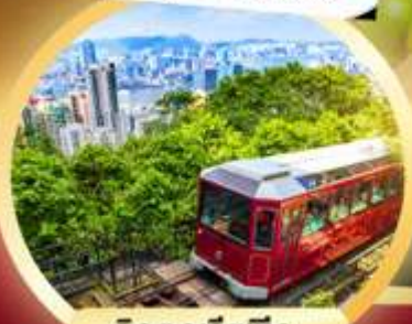
วิคตอเรียพีค