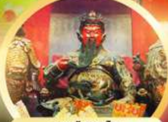
เทพเจ้ากวนโ ความซื่อสัตย์ เงินทอง ธุรกิจมั่นคง