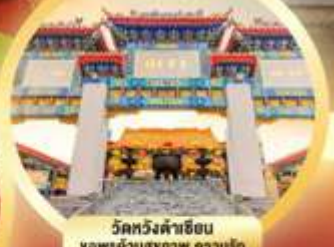
วัดหวังคำซิม ขอพรผ่านสุภาพ ความรัก