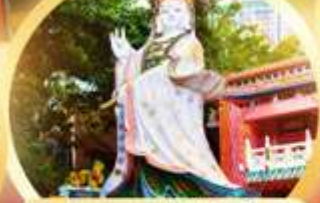
เจ้าแม่กวนอิมรีฟลัสเบีย รับพลังงานดี เสริมพลังดวงรุ่งริฟลัสเบีย