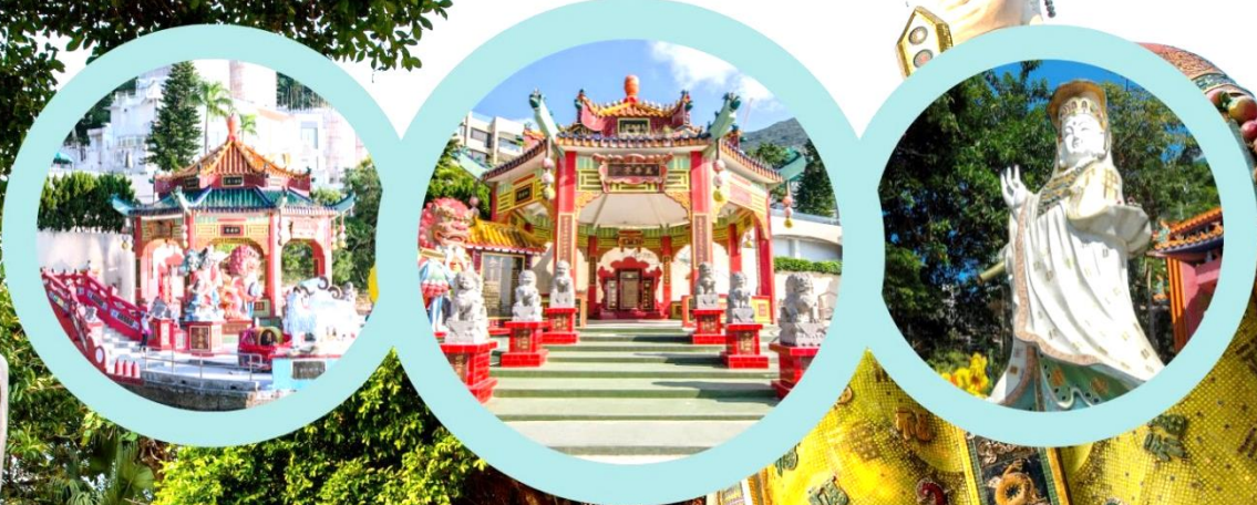
หาดรีพัลส์เบย์ (Repulse Bay)

11.45 น. ถึง สนามบินนานาชาติฮ่องกง (CHEK LAP KOK) หลังจากนั้นนำท่านผ่านพิธีการตรวจคนเข้าเมือง รับสัมภาระเรียบร้อย (เวลาท้องถิ่นเร็วกว่าประเทศไทย 1 ชั่วโมง)