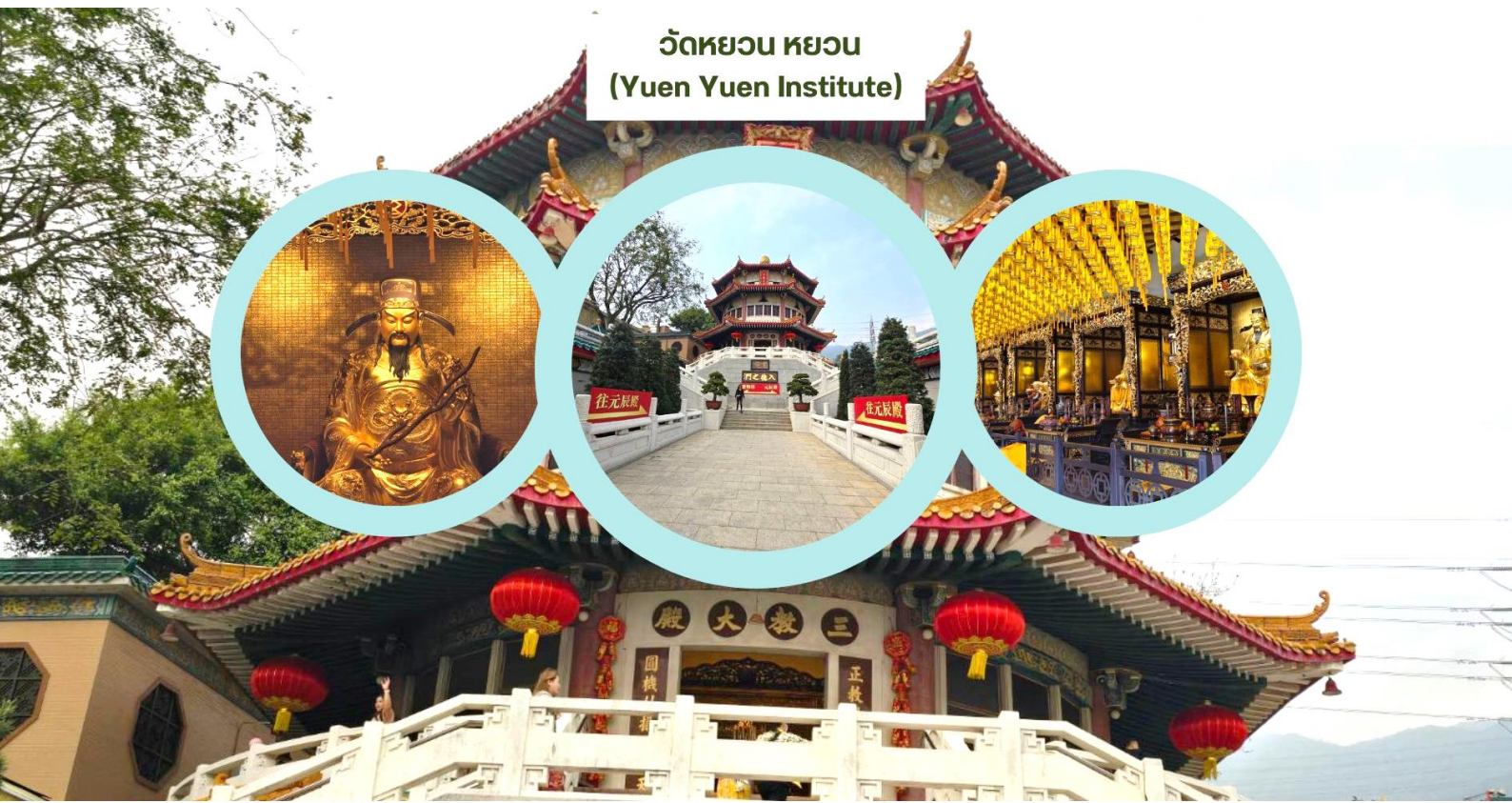
วัดหยวน หยวน (Yuen Yuen Institute)