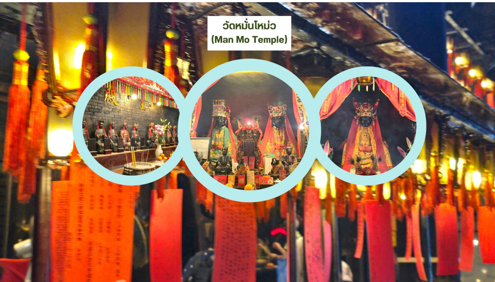
วัดหมั่นโหม่ว (Man Mo Temple)

ฮ่องกง ตั้งอยู่ในย่าน Sheung Wan ขึ้นชื่อในเรื่องการขอพรด้านการเรียน ภายในวิหารโดดเด่นด้วยขดรูปแฉวน ตัดกับฉากหลังสีแดง-ทองอันสง่างาม สร้างขึ้นเพื่อสักการะ เทพเจ้าหมั่นไต่กวัน (Man) เทพแห่งการเรียนรู้ (ด้านบู้) และ เทพเจ้าโหม่วไต่กวัน (Mo) หรือ เทพกวนอู เทพแห่งสงคราม (ด้านบู๊) บรรยากาศภายในวัดงดงามและแฝงด้วยความศักดิ์สิทธิ์เหนือธรรมชาติ