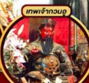
ความซื่อสัตย์ เงินทองเจริญงอกงาม