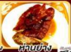
ห่านย่าง