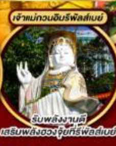
รับพลังงานดี เสริมพลังดวงใจทรัพย์สินสมัย