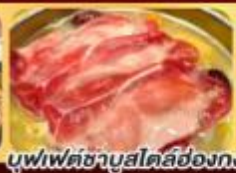
บุฟเฟ่ต์ชาบูสโลว์ค็อกกิ้ง