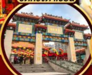
ขอพรสุขภาพความรัก