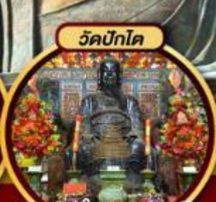
ขอพรเรื่องความสำเร็จ ในชีวิตและการทำงาน