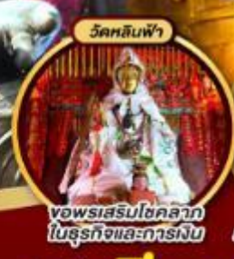
ขอพรเสริมโชคลาภ ในธุรกิจและการเงิน