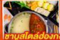
ซาปุสโตลฮ่องกง