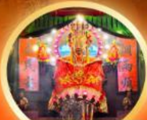
วัดเจ้าแม่กวนอิม ชมพิธีบูชา ความเมตตา บู๊ทางโชคลาภ