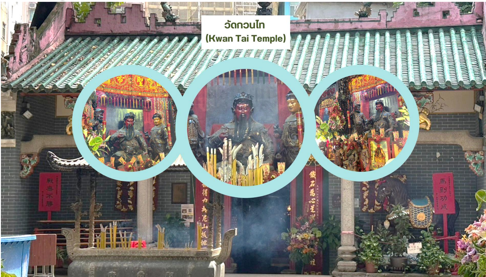
วัดกวนไท (Kwan Tai Temple)

จากนั้นนำท่านเดินทางสู่ วัดกวนไท (Kwan Tai Temple) สร้างขึ้นในปี 1891 เพื่อบูชาเทพเจ้ากวนอู ซึ่งเป็นเทพเจ้าแห่งความซื่อสัตย์ และเปี่ยมไปด้วยคุณธรรม ภายในวัดมีรูปปั้นกวนอูขนาดใหญ่ตั้งอยู่ที่แท่นบูชา มีผู้คนจำนวนมากมาสักการะท่านกวนอูเพื่อขอพรให้ประสบความสำเร็จในธุรกิจ เรื่องความโชคดี โชคลาภ การค้าขาย และการปกป้องคุ้มครอง