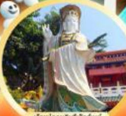
เจ้าแม่กวนอิมฟิลิปปินส์ ชมเทพเจ้ากวนอิม ความเมตตา บู๊ทางโชคลาภ