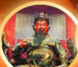
เทพเจ้ากวนอู 5ลวดอก ชมเทพเจ้ากวนอู ความเมตตา บู๊ทางโชคลาภ