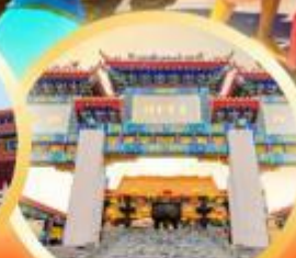
วัดวังต้าเซียง ชมเทพเจ้ากวนอู ความเมตตา