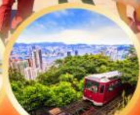
วัดคอเรียพิก