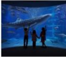
พิพิธภัณฑ์สัตว์น้ำโดยดง