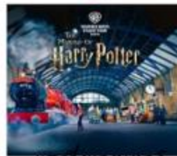
แฮร์รี่ พอตเตอร์ สตูดิโอโตเกียว