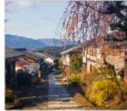
มาโกเมะจุกุ