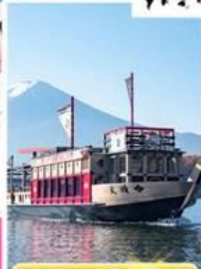
สองเรือซาบูโรอาปาเระ