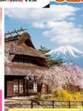
หมู่บ้านอิยาชิโนะซาโตะ