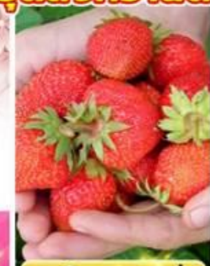
เก็บสตอเบอร์รี่