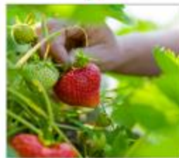
เก็บสตอเมอร์รี่