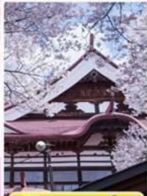
ปราสาทคาโตะ