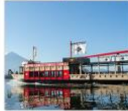
ล่องเรือข้ามไรอาปาเร