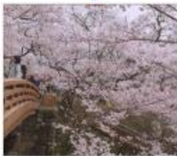
ซากุระปราสาททาดาโตะ