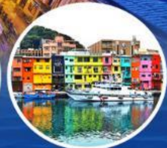
หมู่บ้านชาวประมงหลากสี