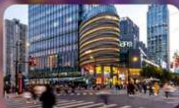
ถนนหอยให้ลู่