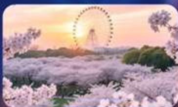
ซากุระบานสวน Gucun Park