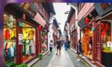
เมืองโบราณซีเป่า