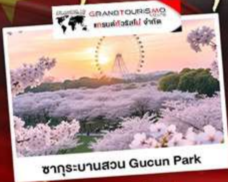
ซากุระบานสวน Gucun Park