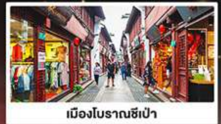
เมืองโบราณซีเป่า