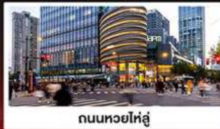
ถนนหวยไห่หลู่