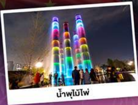
น้ำพุไม้ไฟ

"ภูเขาหิมะ" ภูเขาที่ใหญ่ที่สุด สัมผัสบรรยากาศหิมะขาวโพลน