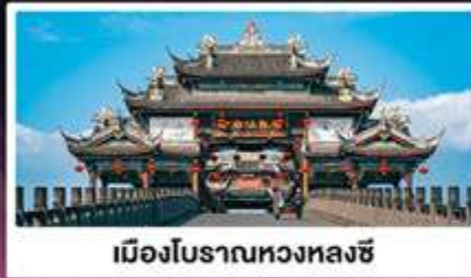
เมืองโบราณหวงหลงซี