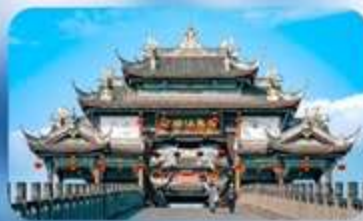
เมืองโบราณหวงหลงซี