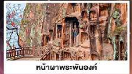
หน้าผาพระพันองค์