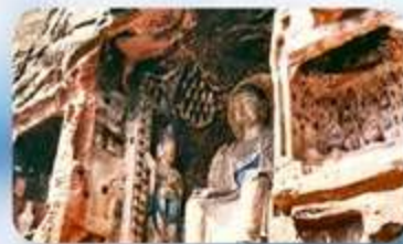
หน้าผาพระพันองค์