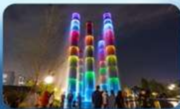
น้ำพุไม้ไผ่