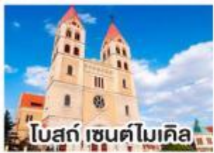
โบสถ์ เซนต์ไมเคิล