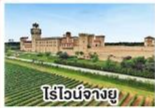
ไร่องุ่นจางยู