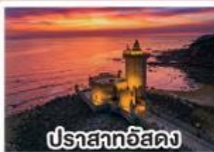
ปราสาทฮัสดง