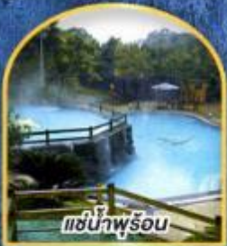
แช่น้ำพุร้อน