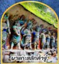
ผาแกะสลักต้าจู้