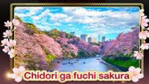
Chidori ga fuchi sakura

ชมความงามดอกซากุระพร้อมดอกนาโนะฮานะ ณ สวนคุดมางางะ ซากุระ ลีลิมิ