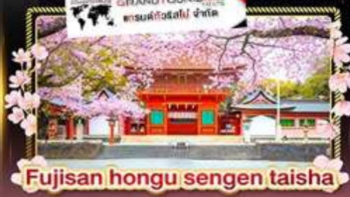
Fujisan hongu sengen taisha