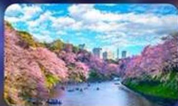
Chidori ga fuchi sakura