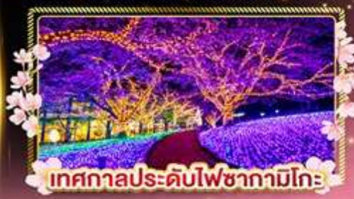
เทศกาลประดับไฟซากุระมิโกะ