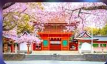
Fujisan hongu sengen taisha