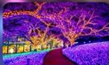
เทศกาลประดับไฟซากามิโกะ