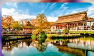
โอชิโนะ ฮักโค

INTERNATIONAL RESORT HOTEL YURAKUJO MARITA หรือเทียบเท่ามาตรฐานญี่ปุ่น