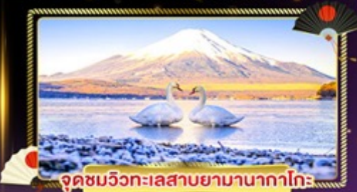
จุดชมวิวกะเลสาบยามานากาโกะ