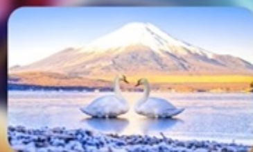
จุดชมวิวกะเลสาบยามานากาโกะ