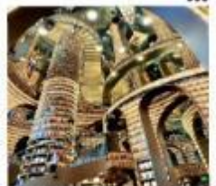
ห้องสมุดจงซูเก้อ