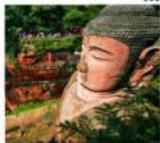
หลวงพ่โตเล่อซาน