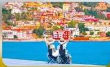
หมู่บ้านชาวประมงซาจื่อโงว