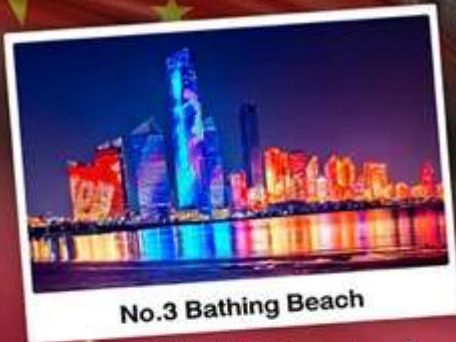
No.3 Bathing Beach