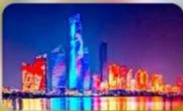
No.3 Bathing Beach