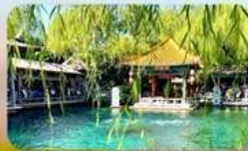
น้ำพุเปาตู