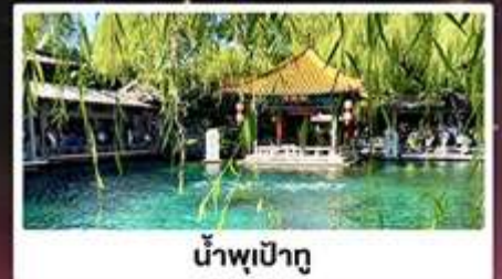
น้ำพุเปาถู