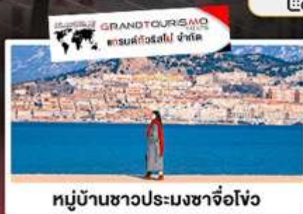
หมู่บ้านชาวประมงชาจ้อโจว