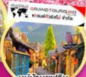
หมู่บ้านยูฟูอิน พลอร์ริลา