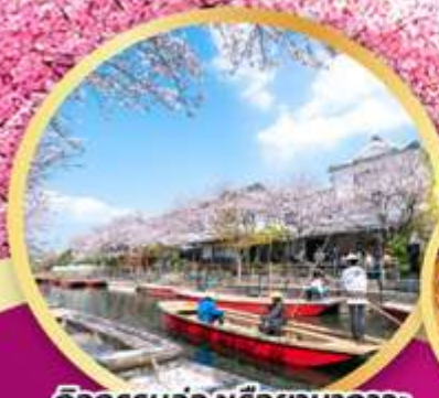
กิจกรรมล่องเรือยามากะวะ