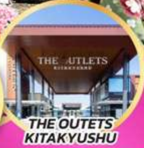
THE OUTLETS KITAKYUSHU