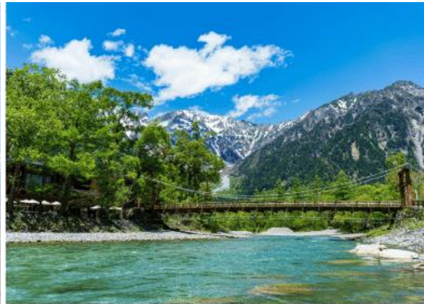
KAMIKOCHI KAPPA BASHI