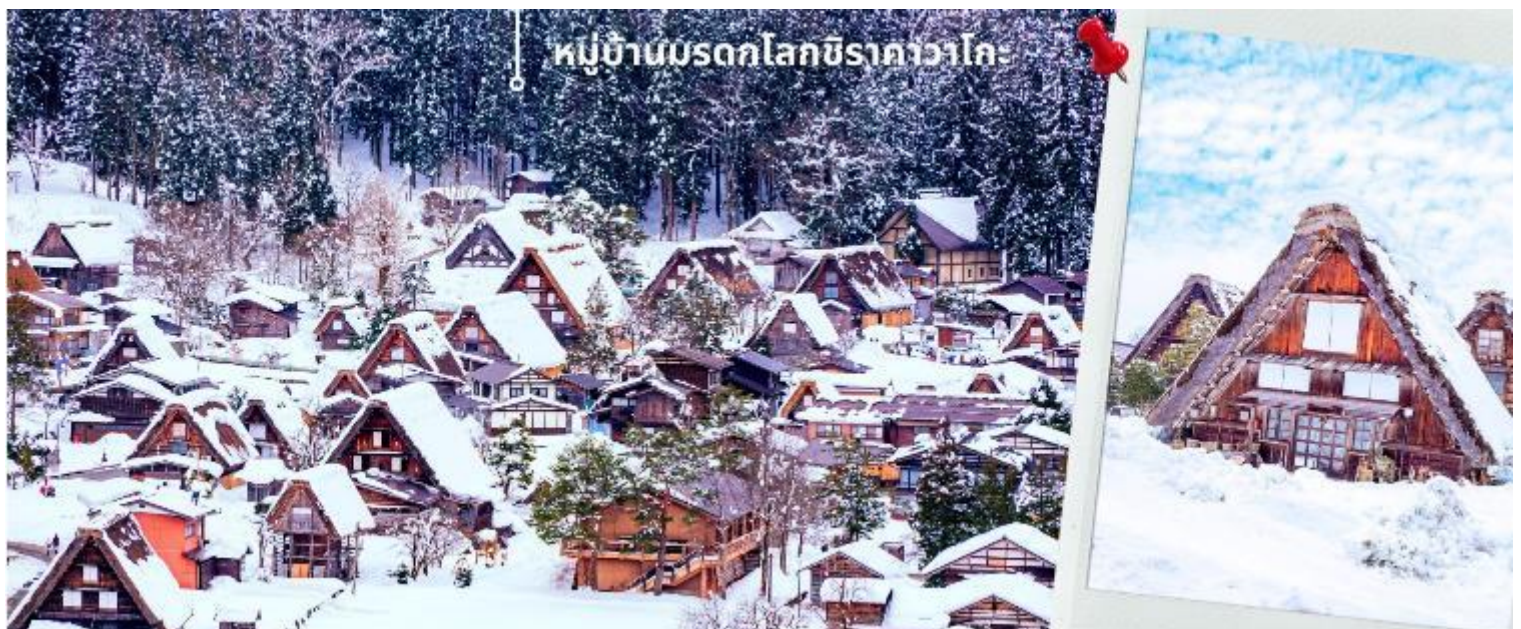
หมู่บ้านมรดกโลกชิราคาวะโกะ

จากนั้นนำท่านเดินทางสู่ เมืองกิฟุ พาท่านเข้าชม หมู่บ้านมรดกโลกชิราคาวะโกะ หมู่บ้านแห่งนี้ ตั้งอยู่ในหุบเขาสูง ห้างไกลความเจริญ ทำให้ยังรักษาขนบธรรมเนียม ประเพณีอันดั้งเดิมไว้ได้อย่างสมบูรณ์ และเป็นหมู่บ้านที่มีรูปร่างแปลกตาติดอันดับ ซึ่งได้ชื่อว่าเป็น The most beautiful village in Japan โดยมีบ้านทรงแบบ “กัสโซสึคุริ” ซึ่งเป็นบ้านชาวนาโบราณที่มีอายุมากกว่า 250 ปี คำว่า กัสโซ มีความหมายว่า พนมมือ ซึ่งคล้ายกับรูปแบบของบ้านที่มีหลังคามุงด้วยฟางข้าวที่ทำมุมชันถึง 60 องศา ราวกับสองมือที่ประนมเข้าหากัน ตัวบ้านมีความยาวประมาณ 18 เมตร กว้าง 10 เมตร ทั้งหลังถูกสร้างขึ้นโดยไม้ไผ่ตะปู ภายหลังในปี 1995 ได้รับการตั้งขึ้นเป็นมรดกโลก