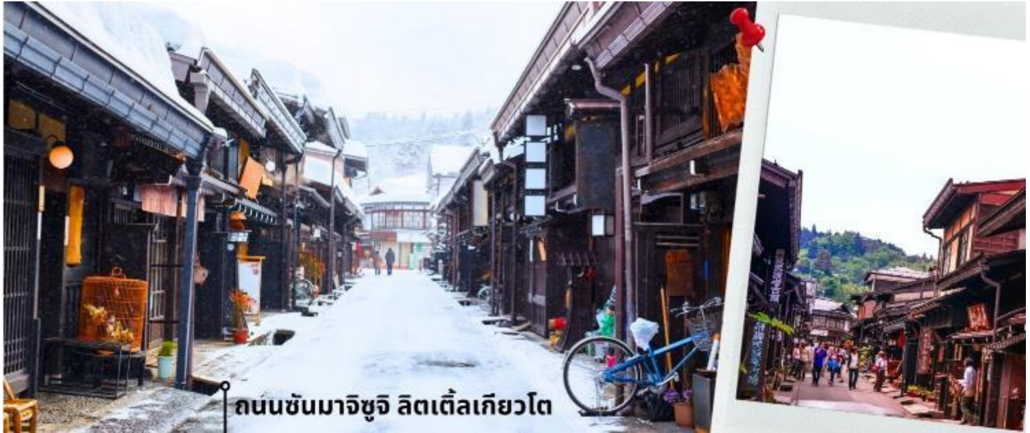
ถนนซันมาจิซุจิ ลิตเติ้ลเกียวโต

จากนั้นนำท่านเดินทางสู่ เมืองกิฟุ พาท่านเข้าชม หมู่บ้านมรดกโลกชิราคาวะโกะ หมู่บ้านแห่งนี้ ตั้งอยู่ในหุบเขาสูง ห้างไกลความเจริญ ทำให้ยังรักษาขนบธรรมเนียม ประเพณีอันดั้งเดิมไว้ได้อย่างสมบูรณ์ และเป็นหมู่บ้านที่มีรูปร่างแปลกตาติดอันดับ ซึ่งได้ชื่อว่าเป็น The most beautiful village in Japan โดยมีบ้านทรงแบบ “กัสโซสึคุริ” ซึ่งเป็นบ้านชาวนาโบราณที่มีอายุมากกว่า 250 ปี คำว่า กัสโซ มีความหมายว่า พนมมือ ซึ่งคล้ายกับรูปแบบของบ้านที่มีหลังคามุงด้วยฟางข้าวที่ทำมุมชันถึง 60 องศา ราวกับสองมือที่ประนมเข้าหากัน ตัวบ้านมีความยาวประมาณ 18 เมตร กว้าง 10 เมตร ทั้งหลังถูกสร้างขึ้นโดยไม้ไผ่ตะปู ภายหลังในปี 1995 ได้รับการตั้งขึ้นเป็นมรดกโลก