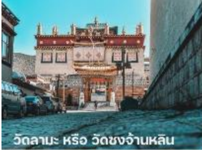
วัดลามะ หรือ วัดชงจาบหลิน