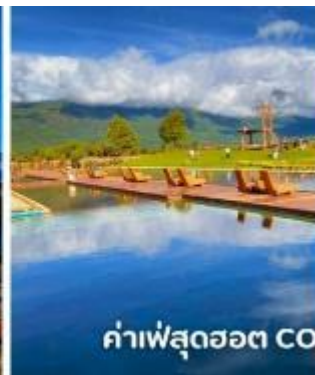
ค่าเฟ่สุดช้อต COFFEE YUN DI AN