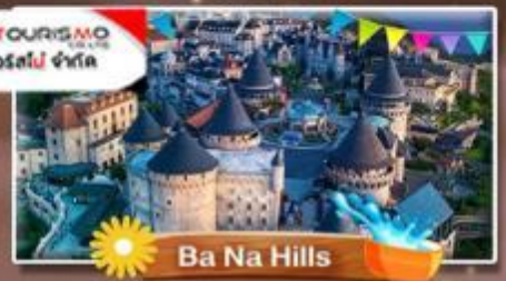
Ba Na Hills