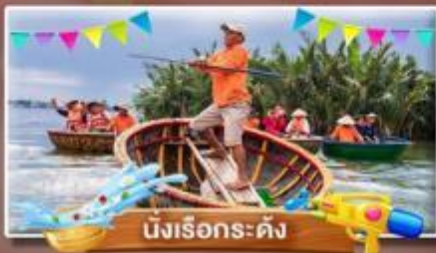
นั่งเรือระดิง