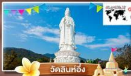
วัดลินท้อ