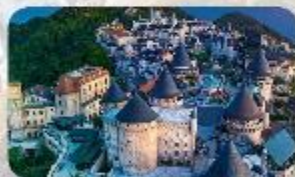
Ba Na Hills