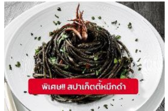
พิเศษ!! สปาเก็ตตี้หมึกดำ

Highlight! เมื่อเยือนเกาะเวนิส เมนูที่ขึ้นชื่อและหากได้มาต้องได้ลิ้มลองสปาเก็ตตี้ผัดซอสหมึกดำที่คลุกเคล้ากับความหอมนุ่มนวลกับบรรยากาศ สุดคลาสสิคฉบับอิตาลีเย็นต้นตำรับเวนิส