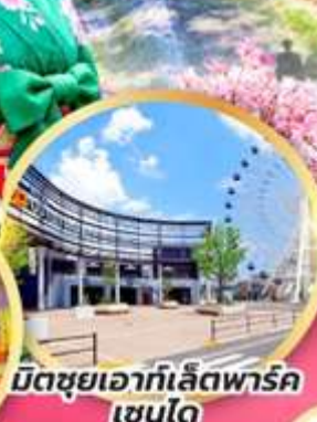
มิตซูเอากะเลียตพาร์ค เซนได

จุดชมซากุระ-พินตัน ฮิโตะเมะ เซ็มบง ซากุระ