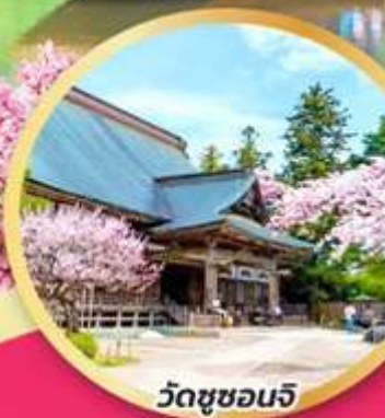
วัดชูซอนจิ