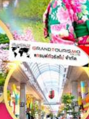
ช้อปปิ้ง ถนนอิชิบังโจ