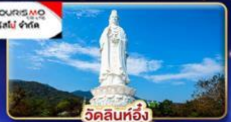
วัดลินห์อึ้ง