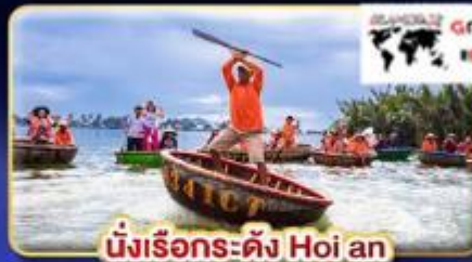
นั่งเรือกระด้ง Hoi an