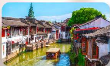
เมืองโบราณจูเจียวเจียว