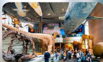
พิพิธภัณฑ์เซี่ยงไฮ้