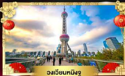
วงเวียนทมิ้งจู