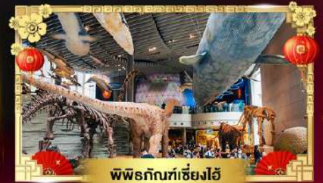
พิพิธภัณฑ์เซี่ยงไฮ้