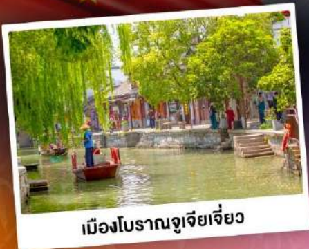
เมืองโบราณซูโจวเจียง