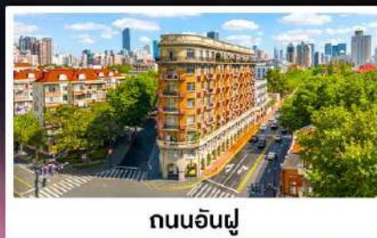
ถนนอันฝู