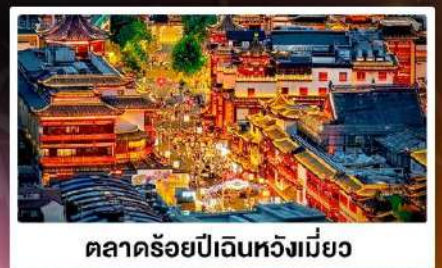
ตลาดร้อยปีฉินหวังเมี่ยว