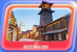
ถ้ำโกะเอะ

บริษัทแกรนด์ทัวร์ริสโม จำกัด GRANDTOURISMO CO.,LTD.