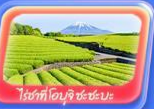
ไร่ชาที่โอบุจิ ชะชะบะ

ฟูจิออนเซ็น 1 คืน โตเกียว 1 คืน นาริตะ 1 คืน