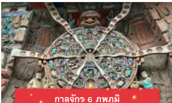
กาลจักร 6 ภพภูมิ