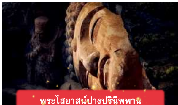
พระไสยาสน์ปางปรินิพพาน