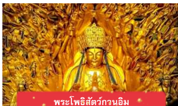
พระโพธิสัตว์กวนอิม

นำท่านเดินทางสู่ มรดกโลกอุทยานผาหินแกะสลักต้าจู๋ ศิลปะหินแกะสลักอันล้ำค่าแห่งเมืองฉงชิ่งมรดกโลกที่องค์การยูเนสโกขึ้นทะเบียนเมื่อปี ค.ศ. 1999 ตั้งอยู่ทางตะวันตกของนครฉงชิ่ง ประเทศจีน ศิลปะหินแกะสลักเหล่านี้สร้างขึ้นตั้งแต่ราชวงศ์ถังจนถึงราชวงศ์ซ่ง มีอายุมากกว่า 1,000 ปีโดดเด่นด้วยงานแกะสลักทางพุทธศาสนาที่งดงามและยังคงสภาพสมบูรณ์ (ใช้เวลาเดินทางประมาณ 1-2 ชั่วโมง)