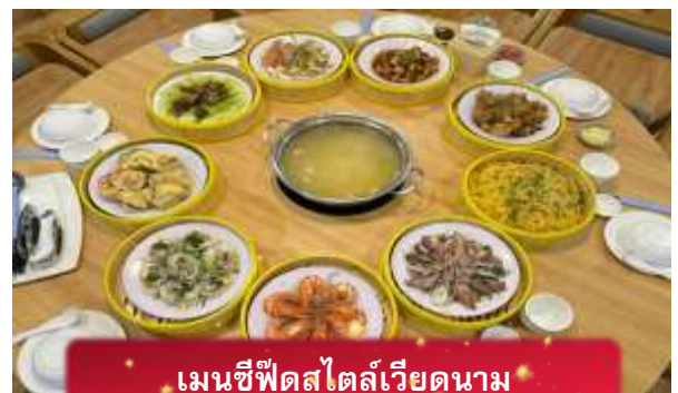
เมนูซีฟู้ดสไตล์เวียดนาม

17.05 เดินทางถึง สนามบินสุวรรณภูมิ โดยสวัสดิภาพ ... พร้อมความประทับใจ