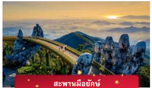
สะพานมียักษ์

นำท่านชม สะพานมียักษ์ แหล่งท่องเที่ยวใหม่ล่าสุดซึ่งอยู่บนเขาบานาฮิลล์ เป็นสะพานสีทองทอดยาวโดยมีมือ 2 ข้างอุ้มไว้ ตั้งอยู่ในตำแหน่งที่โดดเด่นเห็นชัด สวยงาม นำท่านชม สวนดอกไม้แห่งความรัก เป็นสวนดอกไม้สไตล์ฝรั่งเศส ที่มีดอกไม้หลากหลายพันธุ์ถูกจัดเป็นสัดส่วนอย่างสวยงามท่ามกลางอากาศที่แสนเย็นสบาย นำท่านชม สักการะพระพุทธรูปหินอึ้ง เป็นพระพุทธรูปหินองค์ใหญ่ตั้งตระหง่านบนยอดเขาแห่งนี้ ให้ท่านได้ขอพรเพื่อความเป็นมงคล นำท่านชม ป๊อปมาร์ท เป็นร้านค้าของเล่นเปิดใหม่ล่าสุดที่อยู่บนยอดเขาบานาฮิลล์ มีสินค้าของเล่นสำหรับนักจุ่มมากมายให้ท่านได้เลือกชมกับตัวละครน่ารัก อาทิเช่น Molly, SkullPanda, Labubu หมายเหตุ: การจัดการ และข้อกำหนดในการเข้าชมสินค้าอยู่นอกเหนือการจัดการของบริษัททัวร์