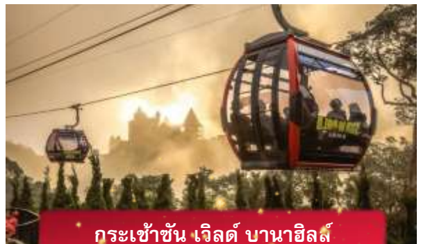
กระเช้าขึ้น เวิลด์ บานาฮิลล์

เที่ยง อีสรอาหารกลางวันเพื่อความสะดวกในการท่องเที่ยว