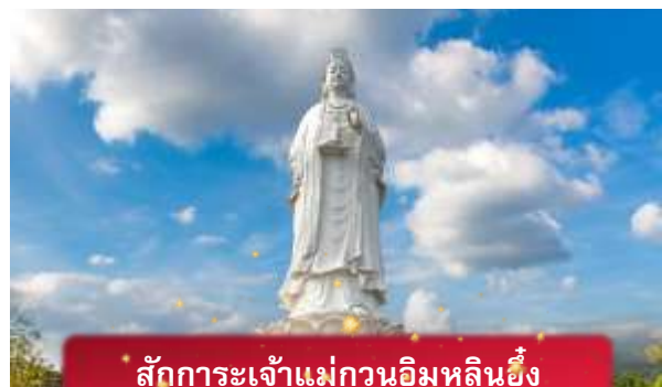
สักการะเจ้าแม่กวอนอิมหลินอึ้ง