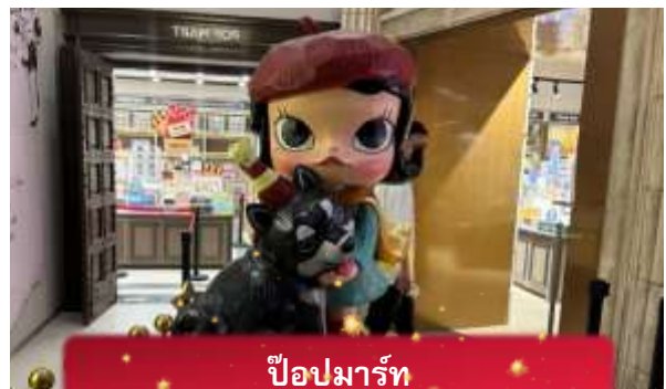
ป๊อปมาร์ท