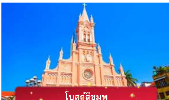
โบสถ์สีชมพู

ค่า บริการอาหารค่ำ ณ ภัตตาคาร พิเศษ ... เมนูบุฟเฟ่ต์ปิ้งย่าง ที่พัก MAGNOLIA HOTEL เทียบเท่าหรือระดับ 4 ดาวท้องถิ่น