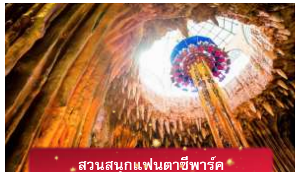
สวนสนุกแฟนตาซีพาร์ค

อิสระท่านท่องเที่ยว สวนสนุกแฟนตาซีพาร์ค ซึ่งมีเครื่องเล่นหลากหลายรูปแบบ เช่น ทำความผจญภัยของหนัง 4D ระทึกขวัญกับบ้านผีสิง เกมส์สนุกๆ เครื่องเล่นเบาๆ รถบั้ง หรือจะเลือกซื้อป๊อปของที่ระลึกของสวนสนุก และ จัตุรัสแห่งดวงดาว เปรียบเสมือนการเดินทางสู่อาณาจักรแห่งดวงดาว ที่มีเส้นทางเชื่อมต่อระหว่างอาณาจักรแห่งดวงจันทร์และอาณาจักรแห่งดวงอาทิตย์ถนนที่แสนงดงาม และสถาปัตยกรรมที่ล้ำสมัยจุดเด่นของที่แห่งนี้ก็คือกระจกใสทรงสามเหลี่ยมที่ดูคล้ายกับพิพิธภัณฑลู่ฟวร์ที่ฝรั่งเศส ให้ความรู้สึกละลานตาเหมือนท่านกำลังท่องอยู่ในโลกแห่งเวทมนต์และดวงดาว (ไม่รวมค่าเข้าชมหุ่นขี้ผึ้ง)