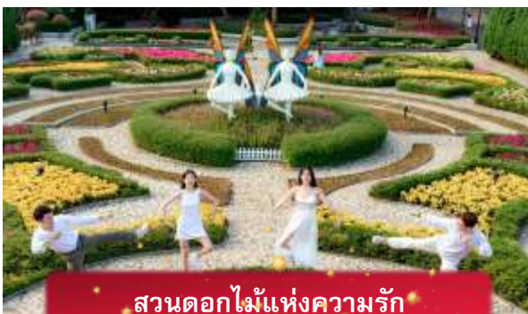
สวนดอกไม้แห่งความรัก