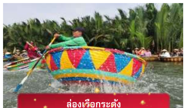
ล่องเรือกระดิ่ง

เช้า บริการอาหารเช้า ณ ห้องอาหารของโรงแรม นำท่านเดินทางสู่ หมู่บ้านกัมทาน เพื่อนำท่าน ล่องเรือกระดิ่ง หมู่บ้าน เล็กๆในเมืองฮอยอันตั้งอยู่ในสวนมะพร้าวริมแม่น้ำ ในอดีตช่วงสงคราม หมู่บ้านแห่งนี้เคยเป็นที่พักอาศัยของทหาร อาชีพหลักของคนที่นี่หมู่บ้านแห่ง นี้คือประมง ระหว่างการล่องเรือท่านจะได้ชมวัฒนธรรมของชาวบ้าน ณ หมู่บ้านแห่งนี้ สามารถให้ทิปได้ตามความพอใจของท่าน จากนั้นนำท่านเดินทางสู่ เมืองโบราณฮอยอัน เมืองมรดกโลกที่ยังคง เอกลักษณ์และรักษาวัฒนธรรมไว้อย่างดีเยี่ยม โดยท่านสามารถเดินเล่น ถ่ายรูป ตามตรอกซอกซอยต่างๆ ได้ ไฮไลท์ของการมา ถ่ายรูปเช็คอินที่นี้คือการได้ขึ้นไปถ่ายรูปจากมุมสูงของคาเฟ่ที่อยู่ตามซอกซอย ได้ทั้งวิว ได้ทั้งชิมกาแฟรสชาติออริจินัลของเวียดนาม