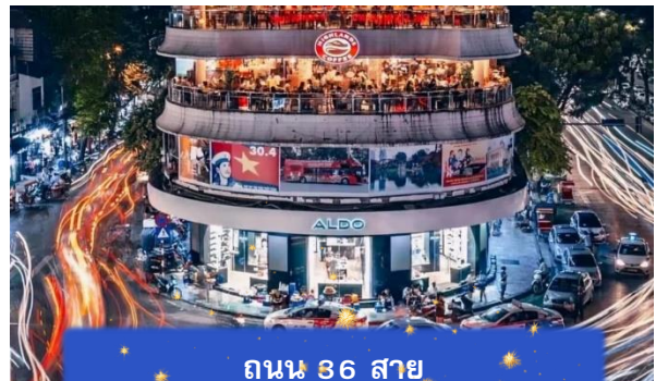
ถนน 36 สาย