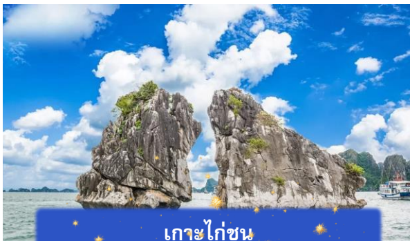
เกาะไก่ชน

เที่ยง บริการอาหารกลางวัน ณ ภัตตาคาร พิเศษ ... เมนูซีฟู้ดบนเรือ