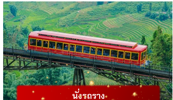
นั่งรถราง

เที่ยง บริการอาหารกลางวัน ณ ภัตตาคาร พิเศษ ... เมนูบุฟเฟ่ฟานซีปัน