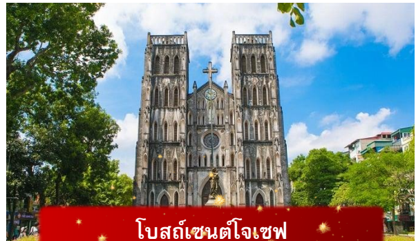
โบสถ์เซนต์โจเซฟ