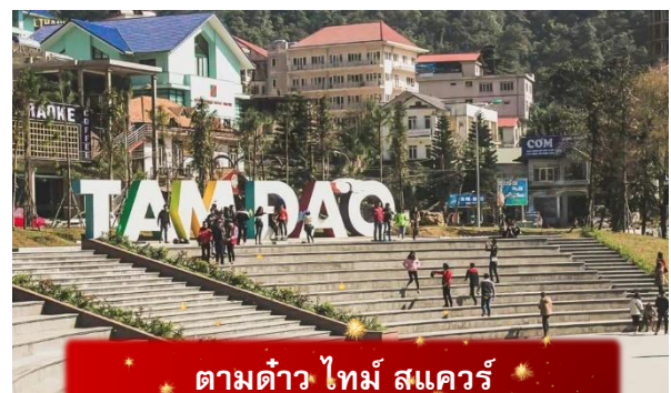
ตามดาว ไทม์ สแควร์

อิสระท่าน ตลาดกลางคืนตามดาว เมื่อแสงแดดลับขอบเขา เมืองบนดอยแห่งนี้จะค่อย ๆ เปลี่ยนบรรยากาศเป็นความคึกคักแบบเรียบง่าย ตลาดกลางคืนตามดาวเต็มไปด้วยของกินพื้นเมือง กลิ่นหอมของหมูย่าง ไชนักระทาก และข้าวโพดย่างล่อคลั่งไปทั่ว นักท่องเที่ยวเดินจับจ่าย พุดคุย และหยุดถ่ายรูปตามแสงไฟที่ประดับอยู่ทั่วตลาด บรรยากาศเป็นกันเองและอบอุ่น เหมาะกับการเดินเล่น ปิดท้ายวันด้วยความสุขเล็กๆ ๆ ที่สัมผัสได้