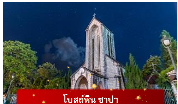
โบสถ์หิน ซาปา