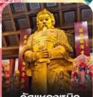
วัดเขกกงหมิว