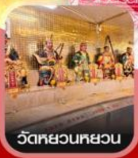
วัดหวนหวน

✈️ คอนเฟิร์มออกเดินทาง ✈️ ทุกพีเรียด 2 ท่านขึ้นไป