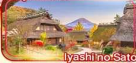
lyashi no Sato