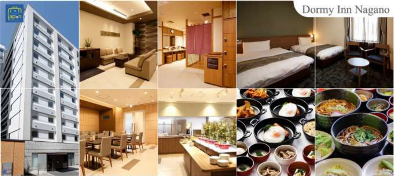
Dormy Inn Nagano

วันที่สาม จังหวัดนากาโน่ – วัดเซนโคจิ – จังหวัดโทยาม่า – สวนอาซาฮี ฟุนะกาว่า – เมืองมัตสึโมโตะ – อีออนมอลล์