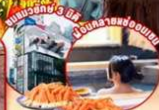
อาบน้ำพุร้อน อื่นๆอีก 3 มิติ