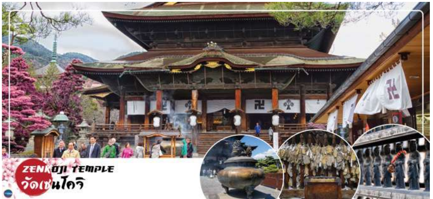
ZENKOJI TEMPLE วัดเซนโคจิ

วันที่สาม จังหวัดนากาโน่ – วัดเซนโคจิ – จังหวัดโทยาม่า – สวนอาซาฮี ฟุนะกาว่า – เมืองมัตสึโมโตะ – อีออนมอลล์