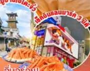
อิมมอร์ทัล! บุฟเฟ่ต์งาปู

📍 ไฮไลท์!! สัมผัสความงาม ดอกชิบะซากุระ ( Shibazakura 2026 ) หรือ สวนสมุนไพรโทยามิกิ ฟุจิควากุจิโกะ เพลิดเพลินไปกับภาพวิวฟูจิ หมู่บ้านโอชิโนะฮกไก วิวภูเขาไฟฟูจิสีขาวตัดกับพื้นหลังสีฟ้า ย้อนยุคไปกับ หมู่บ้านเอโดะจิว ณ คาวาโกเอะ เลือกซื้อสินค้าพื้นเมือง ช้อปปิ้งจิว ไอโคบะ และ ซินจุกุ พร้อมเช็คอิน แบบยักษ์ 3 มิติ