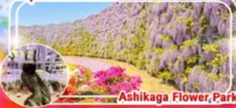
Ashikaga Flower Park