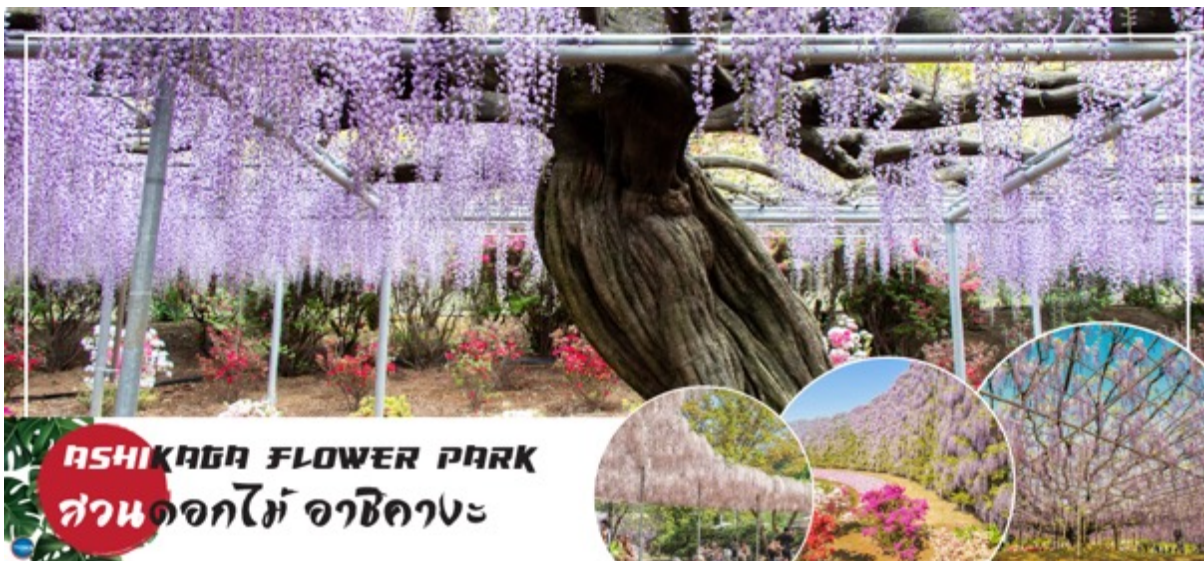
ASHIKAGA FLOWER PARK สวนดอกไม้ อาชิกางะ

วันที่สาม เมืองอิบารากิ – จังหวัดโทชิเงิ – สวนดอกไม้ อาชิกางะ (วิสทีเรีย) – จังหวัดไซตามะ – ย่านเมืองเก่าคาวะโกเอะ – ตรอกลูกกวาด – ศาลเจ้าอิคางะ – จังหวัดยามานาชิ – ออนเซ็น + ชาบูยักษ์