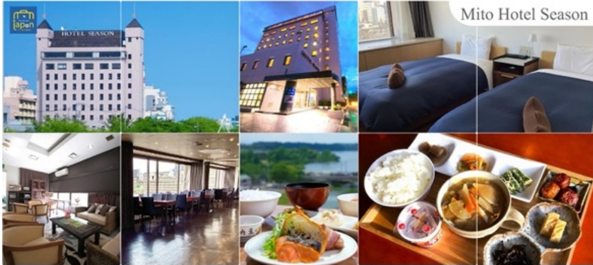
Mito Hotel Season

วันที่สาม เมืองอิบารากิ – จังหวัดโทชิเงิ – สวนดอกไม้ อาชิกางะ (วิสทีเรีย) – จังหวัดไซตามะ – ย่านเมืองเก่าคาวะโกเอะ – ตรอกลูกกวาด – ศาลเจ้าอิคางะ – จังหวัดยามานาชิ – ออนเซ็น + ชาบูยักษ์