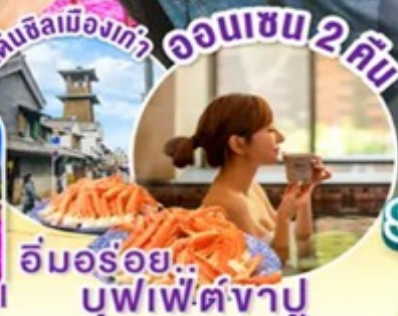
ออนเซ็น 2 คืน อัมมร่อย... บุฟเฟ่ต์ซาปู