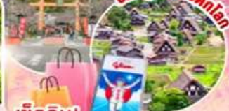
เช็คอิน! ป้ายกุหลิบะแมน

ชมซากุระศาลเจ้าฮิราโนะ ชมหมู่บ้านมรดกโลก