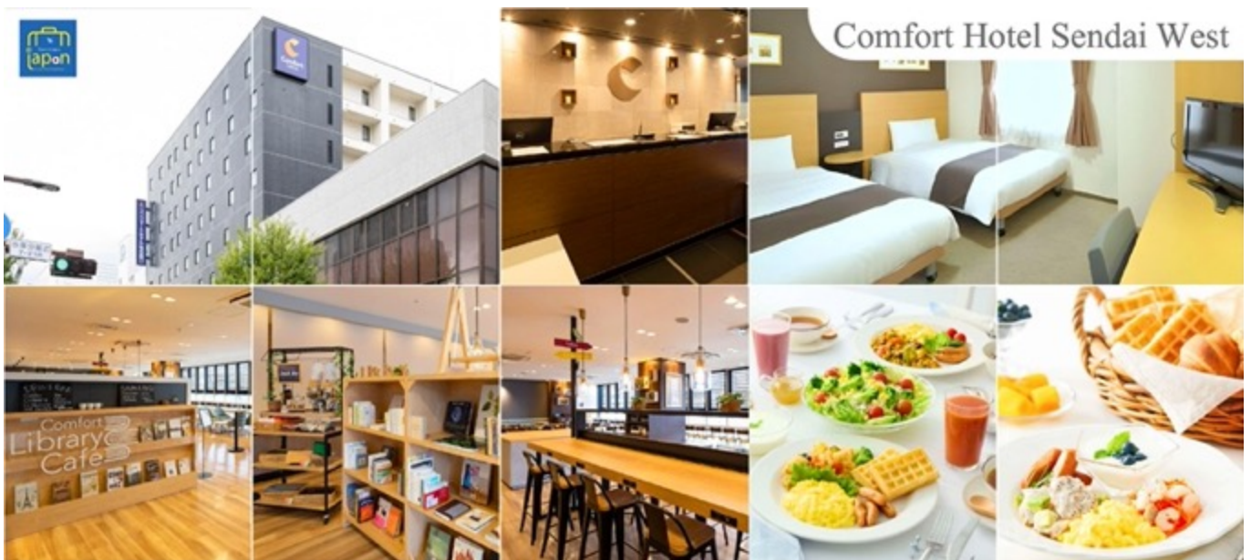
ที่พัก COMFORT HOTEL SENDAI WEST, SENDAI หรือเทียบเท่าระดับเดียวกัน