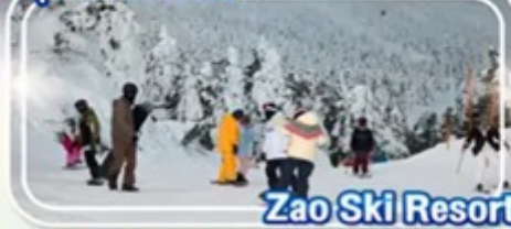
Zao Ski Resort