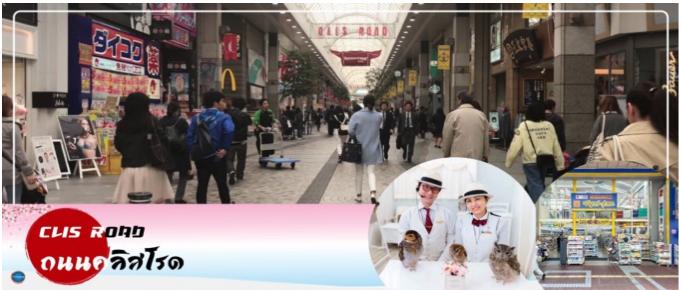
เย็น อีสระรับประทานอาหารเย็นตามอัธยาศัย

จากนั้นนำท่านสู่ ถนนคิสโรด (Clis Road) ถนนสายช้อปปิ้งที่ใหญ่ที่สุดของเมือง มีสินค้าให้เลือกหลากหลายตั้งแต่อาหารท้องถิ่นหรือฟาสต์ฟู้ด ร้านคาเฟ่เก๋ๆ ศูนย์เกมส์ ไปจนถึงแบรนด์เนมระดับไฮเอน HILIGHT!!! สำหรับย่านนี้คือ คาเฟ่กุกุโร (Fukuro Café) ตั้งอยู่ติดที่อยู่หลังร้าน Gucci มีค่าเช่า 1,200 เยน ซึ่งราคานี้รวมกับค่าเครื่องดื่มแบบไม่อั้น โดยจะมีกุกุโรที่ถูกฝึกจนเชื่อฟังอยู่หลากหลายสายพันธุ์ แต่ละตัวล้วนมีความน่ารักที่ต่างกันไป ที่สำคัญยังสามารถลูบหรือจับได้ภายในการดูแลของพนักงานผู้ชำนาญการ อีสระให้ท่านช้อปปิ้งตามอัธยาศัย