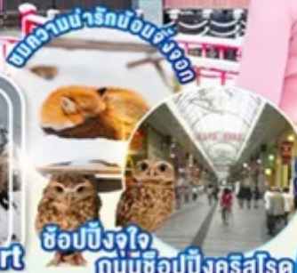
ช้อปปิ้งจิ้งจอกที่เมืองซัปโปโระ กับช้อปปิ้งคิงส์โรด

ไฮไลท์!! สัมผัสความงามของแหล่งออนเซ็นชื่อดัง กินช้อนออนเซ็น ลานกิจกรรม ณ ซาโอะ ออนเซน สกีรีสอร์ท พื้นที่สนุกกับหิมะ-กิจกรรมกลางแจ้ง ชมความน่ารักของม่อนจิ้งจอกที่ หมู่บ้านจิ้งจอกญี่ปุ่น ภูเขาซาโอะ หมู่บ้านโออูจิ จุกุ หมู่บ้านโบราณสมัยเอโดะที่ยังคงเสน่ห์ดั้งเดิม ช้อปปิ้งจุกุ ณ เมืองเซนไดที่ ถนนช้อปปิ้งคิงส์โรด