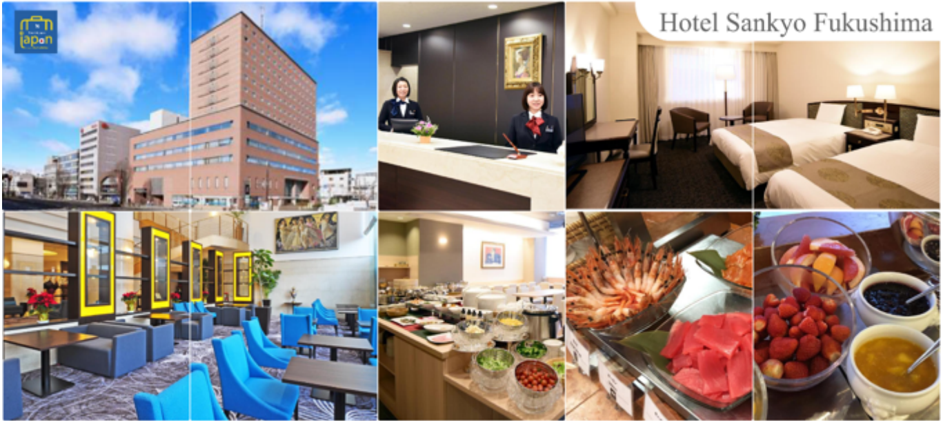
Hotel Sankyo Fukushima