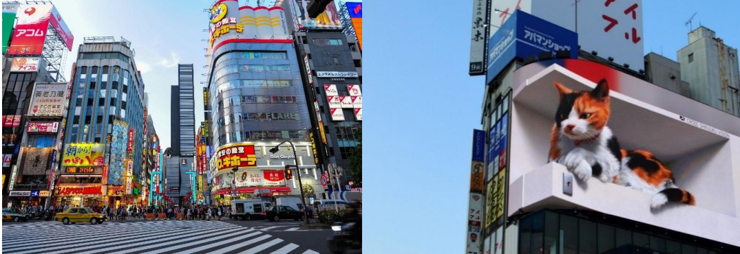
คำ อิสระอาหาร ตามอริยาศัยเพื่อสะดวกแก่การท่องเที่ยว ที่พัก ASIA NARITA HOTEL, NARITA หรือเทียบเท่า