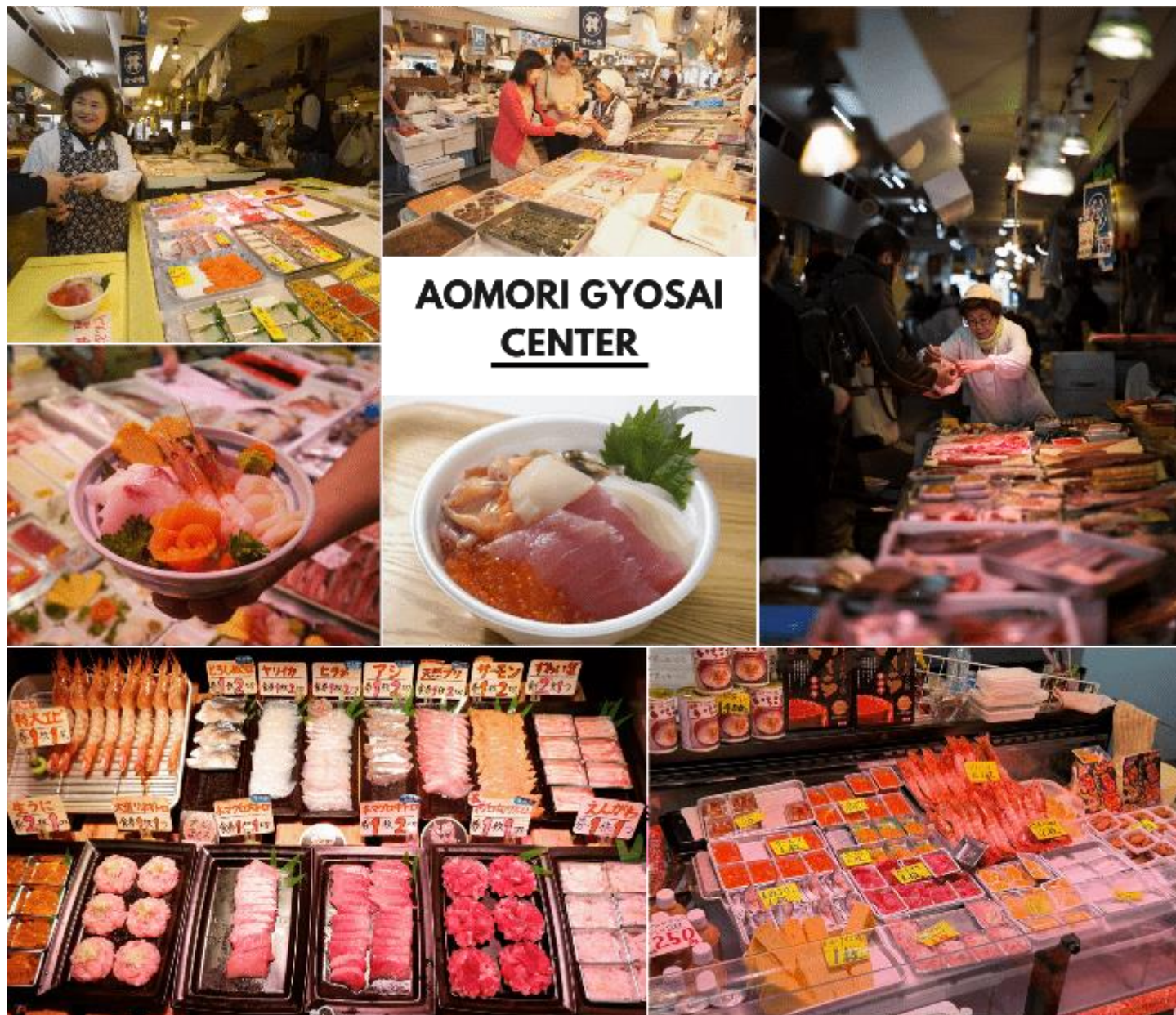
รูปภาพเซเพอประกอบการโฆษณาเท่านั้น

นำท่านเดินทางสู่ ตลาด Aomori Gyosai Center หรือ ตลาดปลาฟรุกะวะ เป็นตลาดปลาชื่อดังในจังหวัดอาโอโมริ เป็นจุดท่องเที่ยวหลักของจังหวัดเลยก็ว่าได้ ที่ตลาดแห่งนี้มีอาหารชนิดหนึ่งที่พิเศษกว่าตลาดปลาที่อื่น และทุกคนที่มาอาโอโมริต้องอยากลิ้มลองได้รับประทาน นั่นก็คือ “นกกะดง” (Nokkedon) ข้าวญี่ปุ่นที่ผ่านการปรุงรสผสมน้ำส้มสายชูแบบข้าวซูชิ เมนูข้าวที่ท่านจะได้สนุกกับการเลือกหน้าเป็นท็อปปิ้งด้วยอาหารทะเลต่าง ๆ ตามใจชอบ ไม่ว่าจะเป็นกุ้งหอยปูปลา วิธีการแสนง่าย เพียงซื้อ “Donburi Gohan” หรือ ข้าวเปล่าใส่ถ้วย จากนั้นเวียนดูแต่ละร้านภายในตลาด แล้ววางอาหารอย่างเช่นปลาดิบหรืออาหารทะเลต่าง ๆ ไว้บนข้าวก็เป็นอันเสร็จสิ้น มาเดินเล่นวนเวียนในตลาดแล้วสนุกไปกับการทำ “ข้าวหน้าตามใจฉัน” ของตัวเองกัน