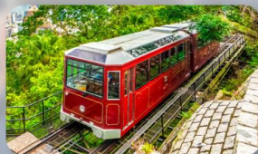
รถรางพักแรม