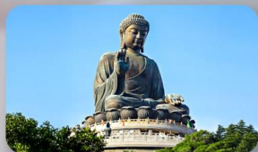
พระใหญ่ฮ่องกง