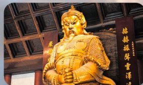
วัดเข่งกหวิว