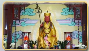
วัดพระกั๋งซำจั้ง