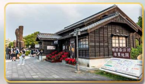
หมู่บ้านฮินเก้