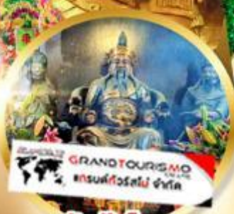
วัดปักโต

เสริมโชคลาภนำความรุ่งเรือง ทุกด้านของชีวิต