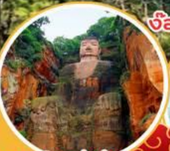
พระใหญ่เล่อซาน