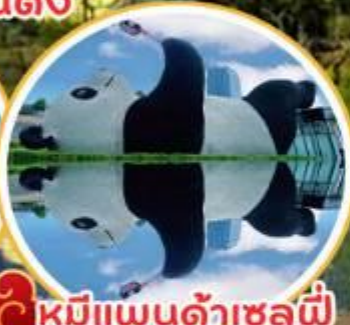
หมีแพนด้าเซลพี่